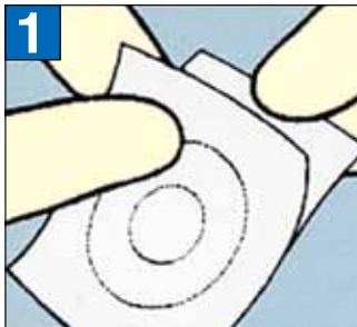
Öffnen Sie die Verpackung