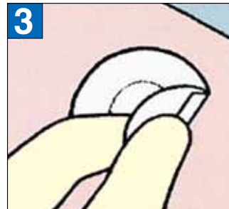
Bringen Sie es an der Einstichstelle an, indem Sie es weiterhin an dem Teil mit Schutzpapier auf der Rückseite festhalten.