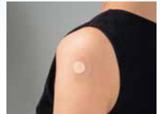
Nach intravenösen Injektionen, Blutentnahmen und Impfungen

Pflaster für Pflaster steril verpackt. Verhindert Keiminfektionen durch Anwendung mit einem Handgriff. Trägt zur Arbeitseinsparung bei.